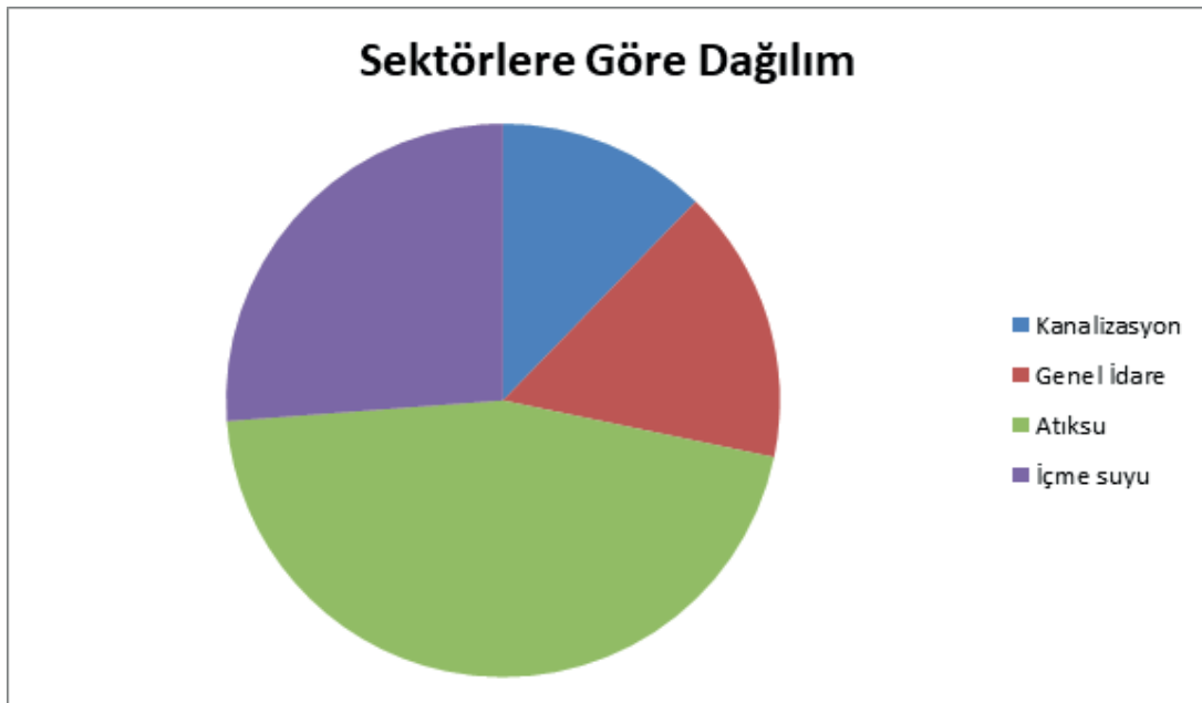
Grafik 2. 2022 Yılı Yatırımlarının Sektörlere Göre Dağılımı

Yatırım projelerinin sektörel ayrımına bakıldığında 9 içme suyu, 4 kanalizasyon ve 4 atıksu arıtma projesinin yer aldığı görülmektedir. Kurumun genel idareye ilişkin hizmetlerinin etkili şekilde yürütülmesi için de 5 proje yatırım programı kapsamına alınmıştır.